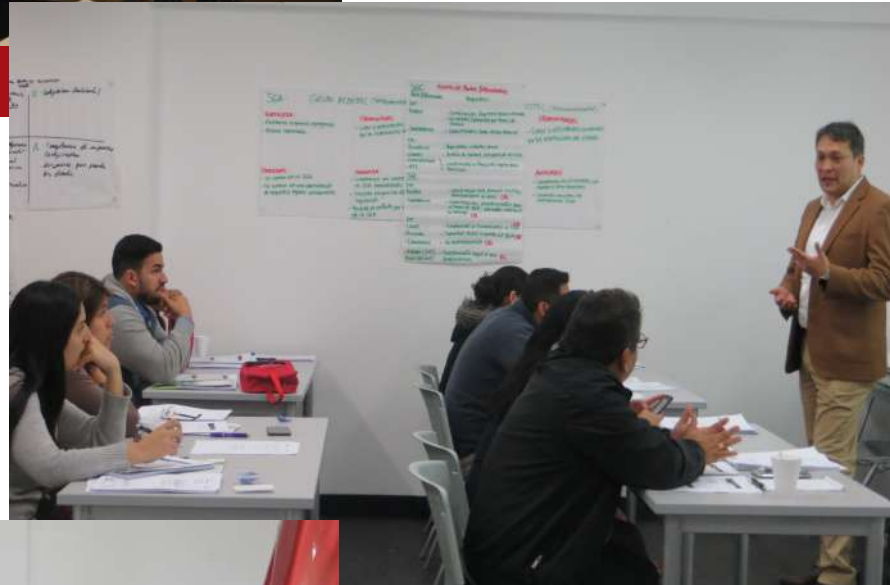
Capacitación en Sistemas Integrados de Gestión ISO 9001, ISO 45001, ISO 14001.