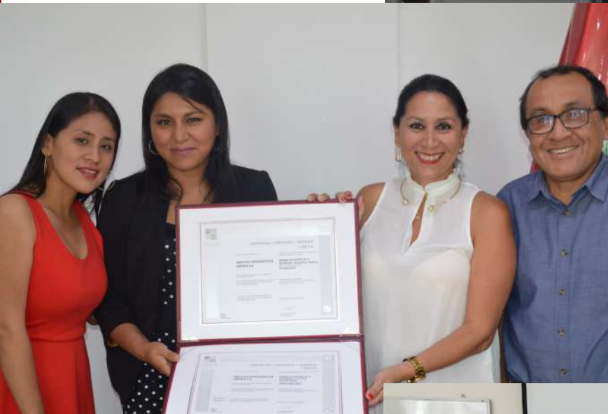
Se logró Certificación en SILSA, gracias a consultoría en ISO 45001:2018.