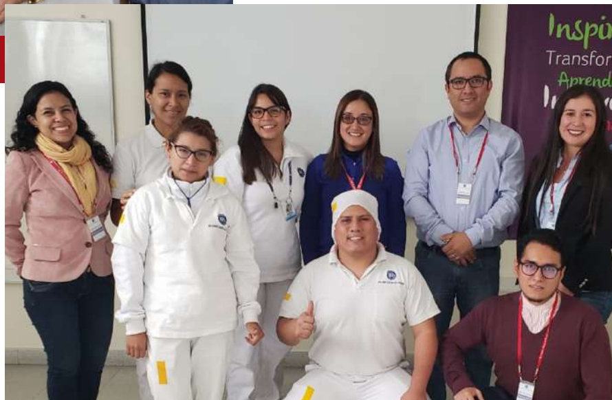
Certificación ISO 45001 en la Compañía Nacional de Chocolates de Perú. Consultoría a cargo de Consultores LAM Group.