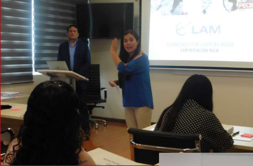
Curso de Auditor Líder ISO 45001 con Certificación PECB-Canadá.